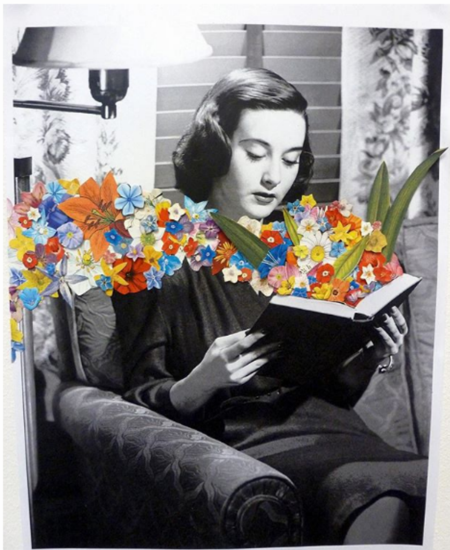
Imagen de Ben Giles