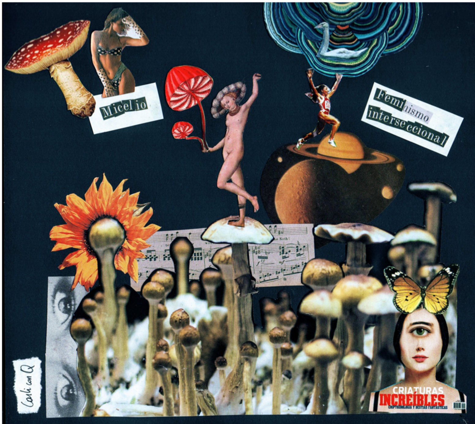
Collage de Carli con Q

CRIAATURAS INCREÍBLES CRIOPTOMANÍA Y BESTIAS FANTÁSTICAS